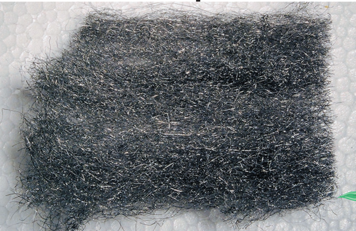
Trozo de lana de acero