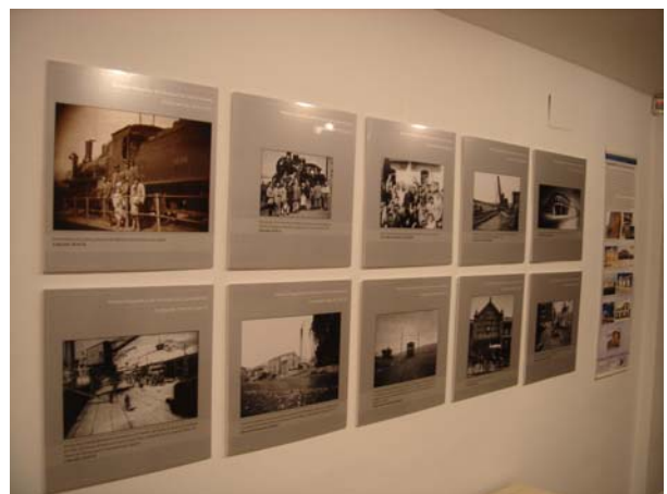
Formatos de edición de la muestra fotográfica similares a los de la Memoria Linares-Almería, organizada por Asafal.